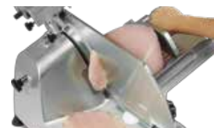
Cuchilla fabricada en Italia

SERVICIO Y REFACCIONES DISPONIBLES Contamos con una red de centros de servicio en toda la república: rhino.mx/servicio.html