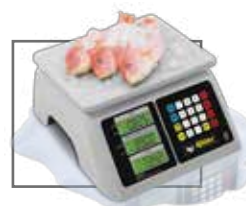
Ideal para pescaderías