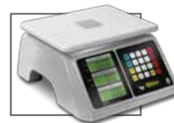
Incluye mica protectora