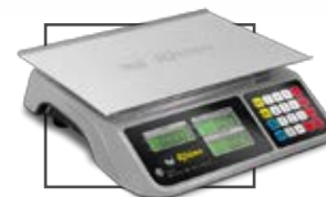
Incluye mica protectora