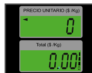
Pantallas de cuarzo con iluminación (backlight)